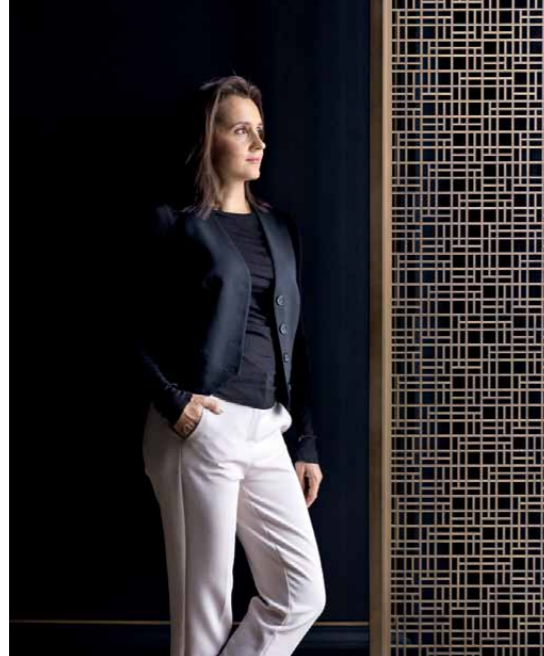
Автор проекта дизайнер АННА САХАРОВА

В центре столицы расположился новый жилой комплекс от VESPER—14-этажный клубный дом Brodsky с белоснежными фасадами и вытянутыми арками. Своим архитектурным обликом он определённо выделяется среди прочей застройки Саввинской набережной, а выгодное расположение здания позволяет любоваться из окон его квартир панорамными видами на набережные Москвы-реки, Воробьёвы горы и Новодевичий парк. Именно в этом доме находится квартира, которую приобрели заказчики—семейная пара с двумя детьми. В дизайн-бюро BELLARDO владельцы изначально обратились за услугой по наполнению готового жилого пространства мебелью и предметами декора, так как квартиры